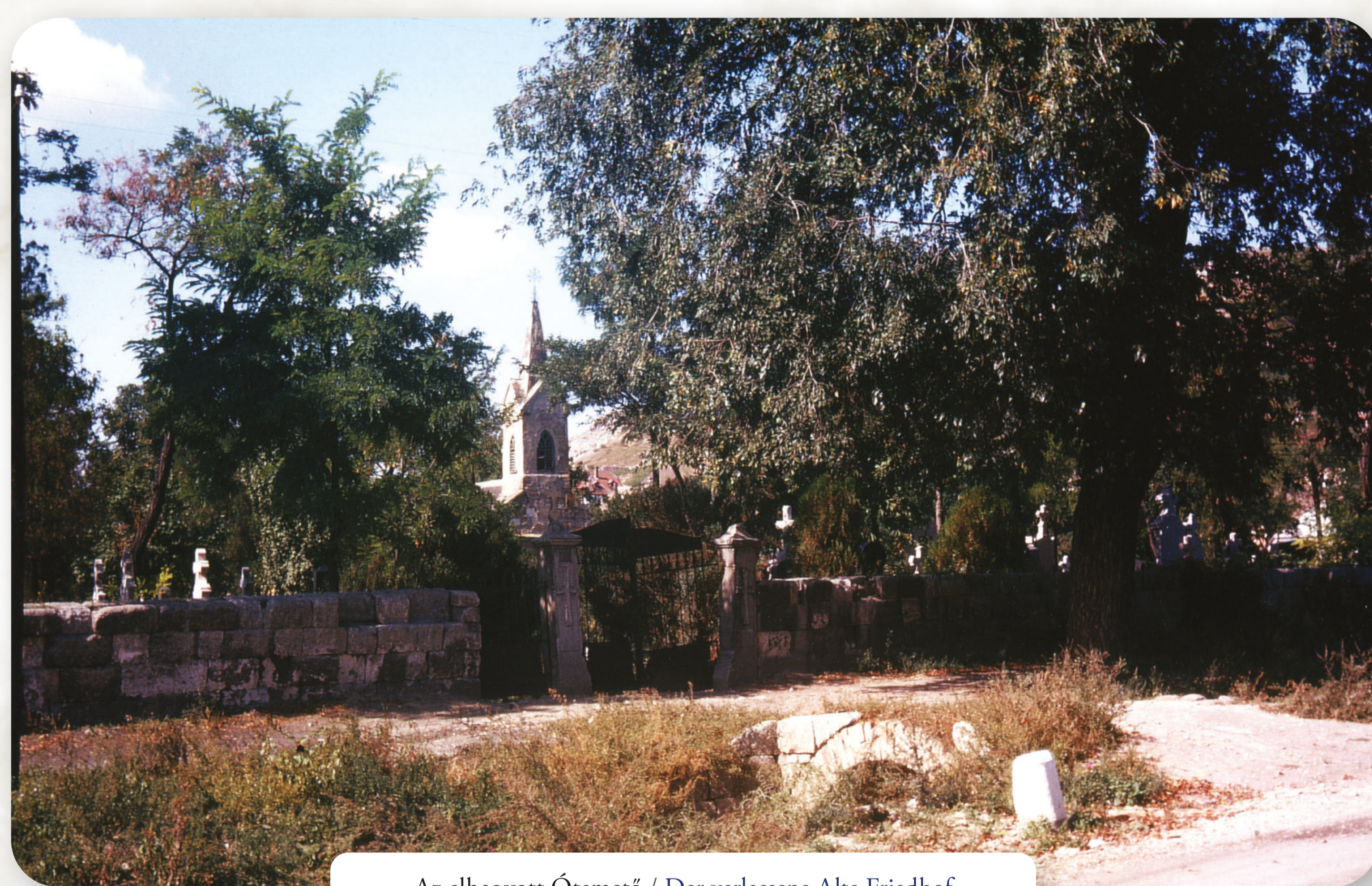
Az elhagyott Ótemető / Der verlassene Alte Friedhof