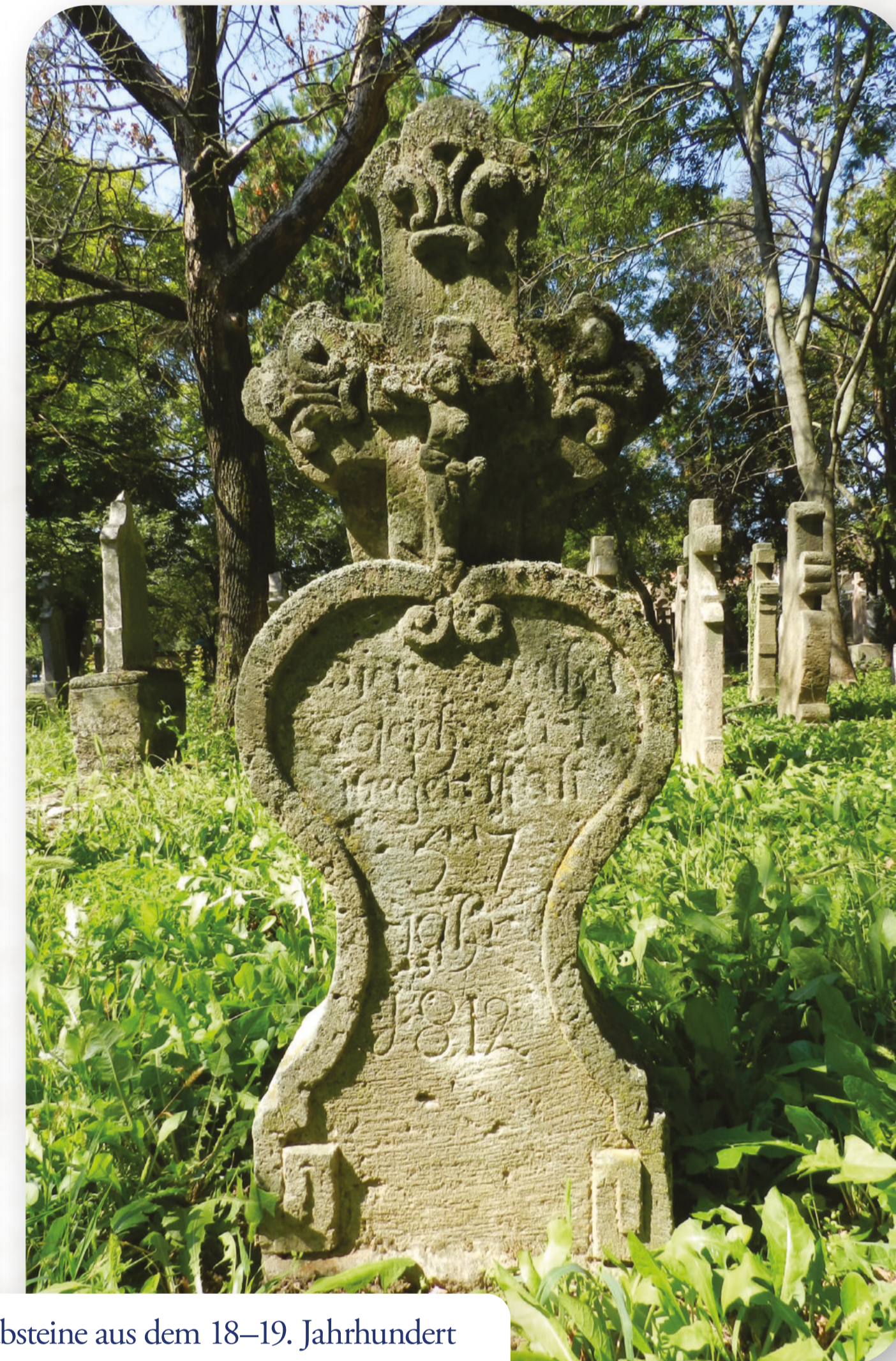
XVIII-XIX. századi sírkövek / Grabsteine aus dem 18-19. Jahrhundert (Bleyer Jakob Helytörténeti Gyűjtemény / Jakob Bleyer Heimatmuseum)