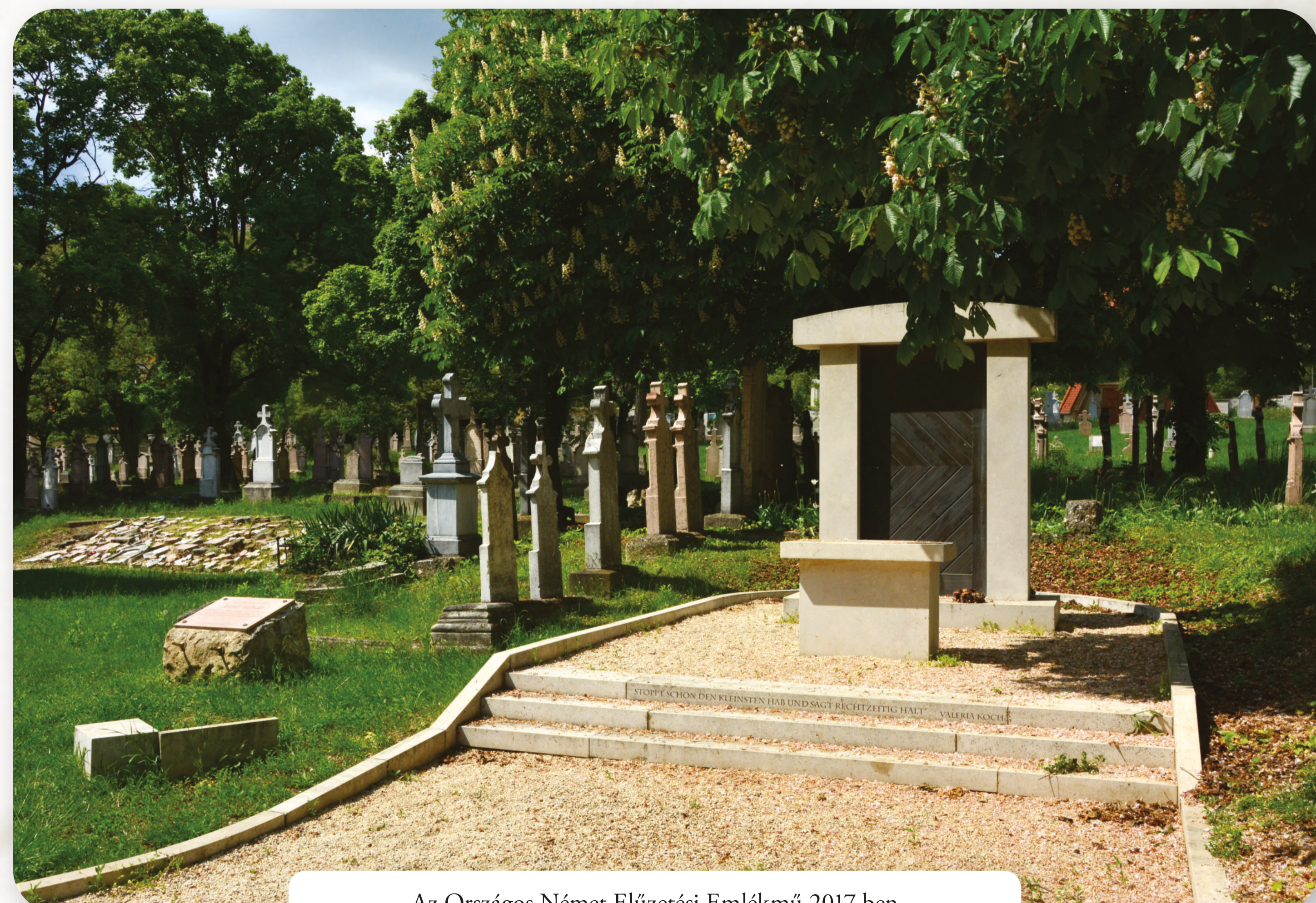
Az Országos Német Elűzetési Emlékmű 2017-ben Das Landesdenkmal der Vertreibung der Ungarndeutschen 2017