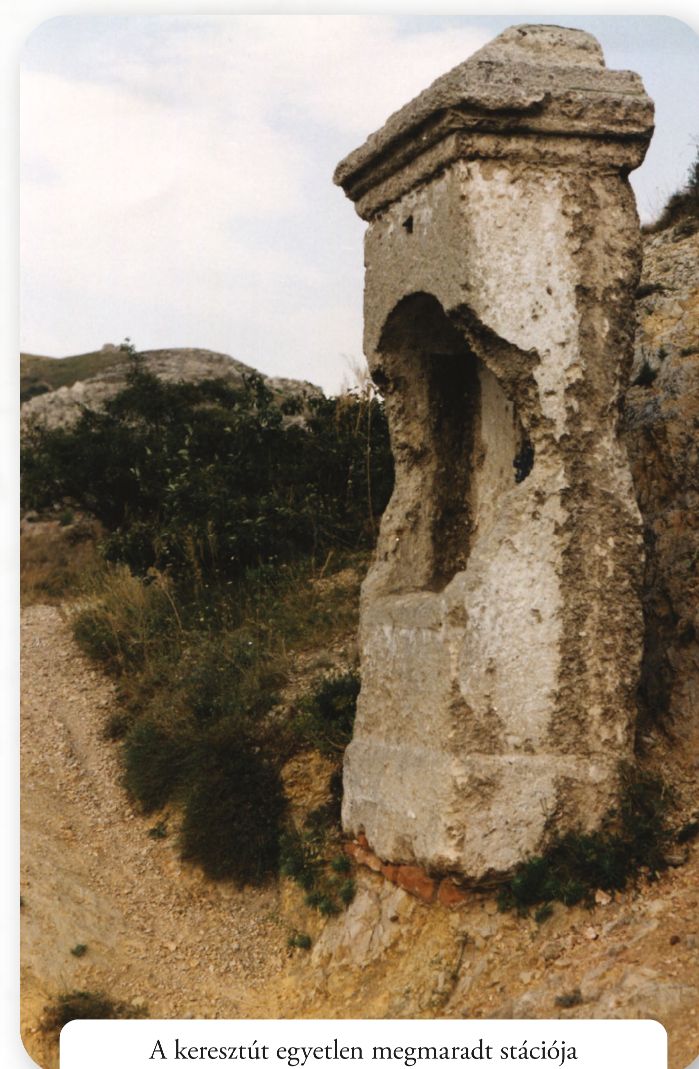
A keresztút egyetlen megmaradt stációja Die einzige, erhalten gebliebene Station des Kreuzwegs