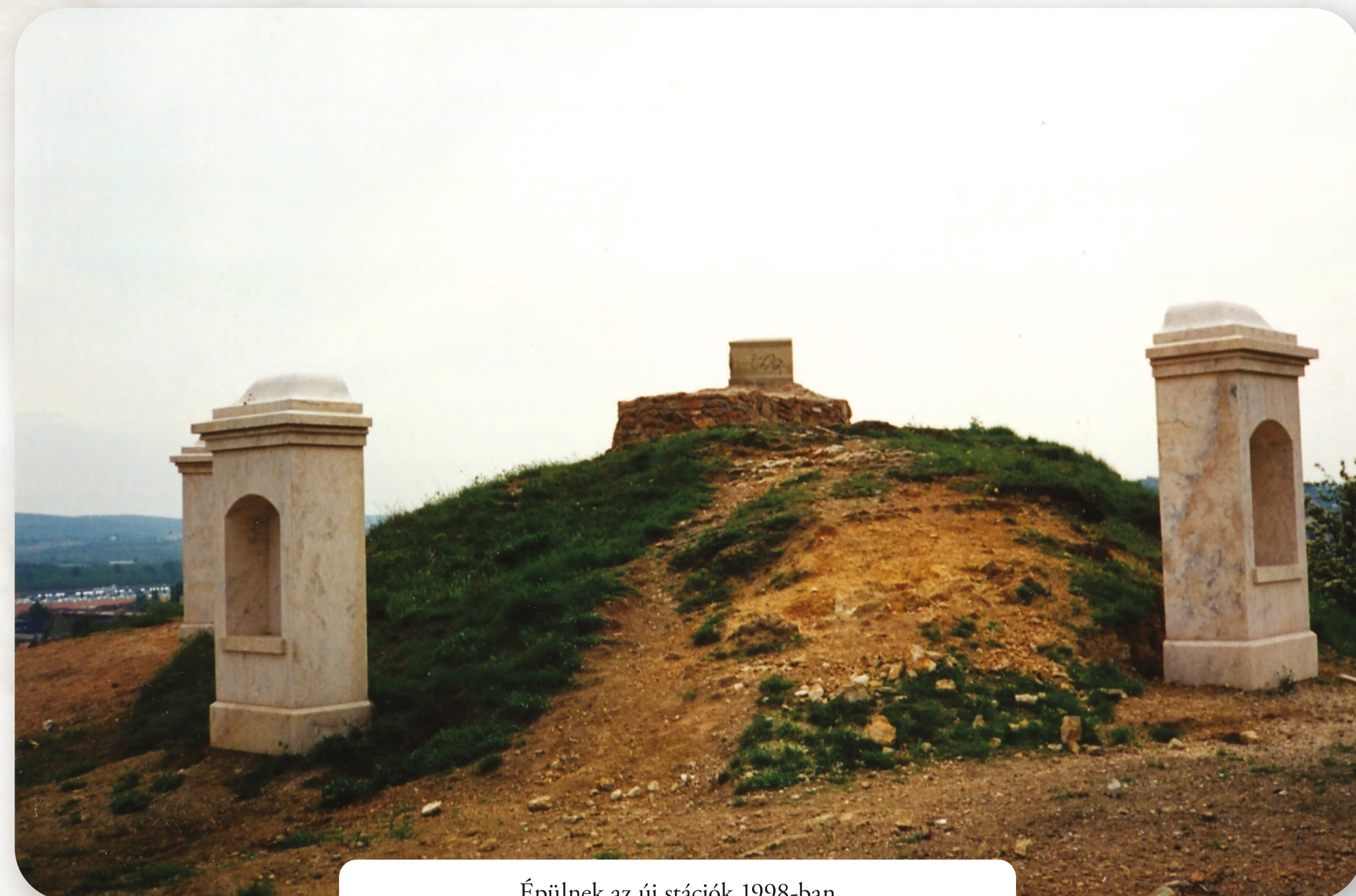
Épülnek az új stációk 1998-ban Die neuen Nischenblöcke werden errichtet, 1998