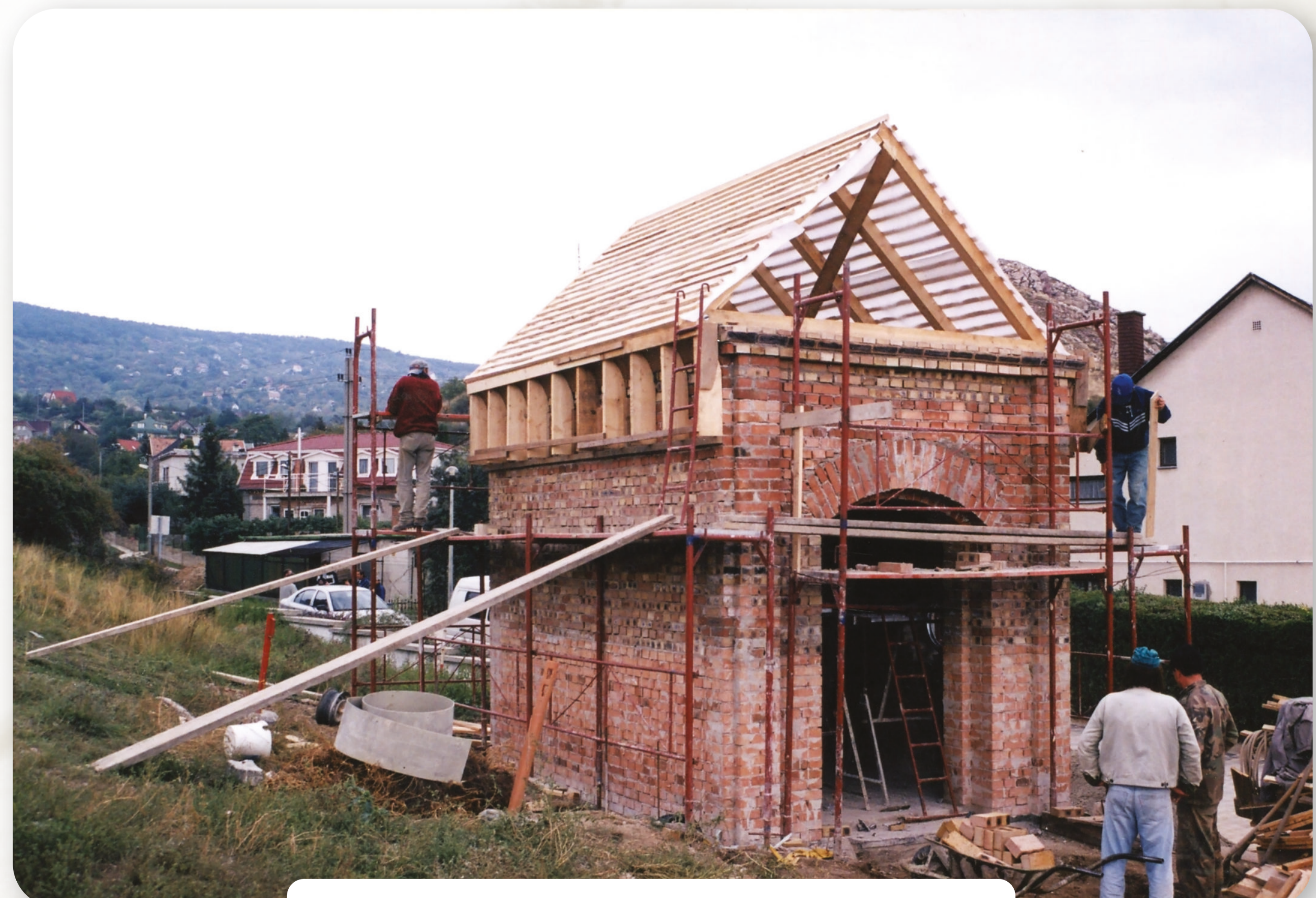
A Kálvária kápolna építése 2002-ben / Bau der Kalvarienkapelle 2002