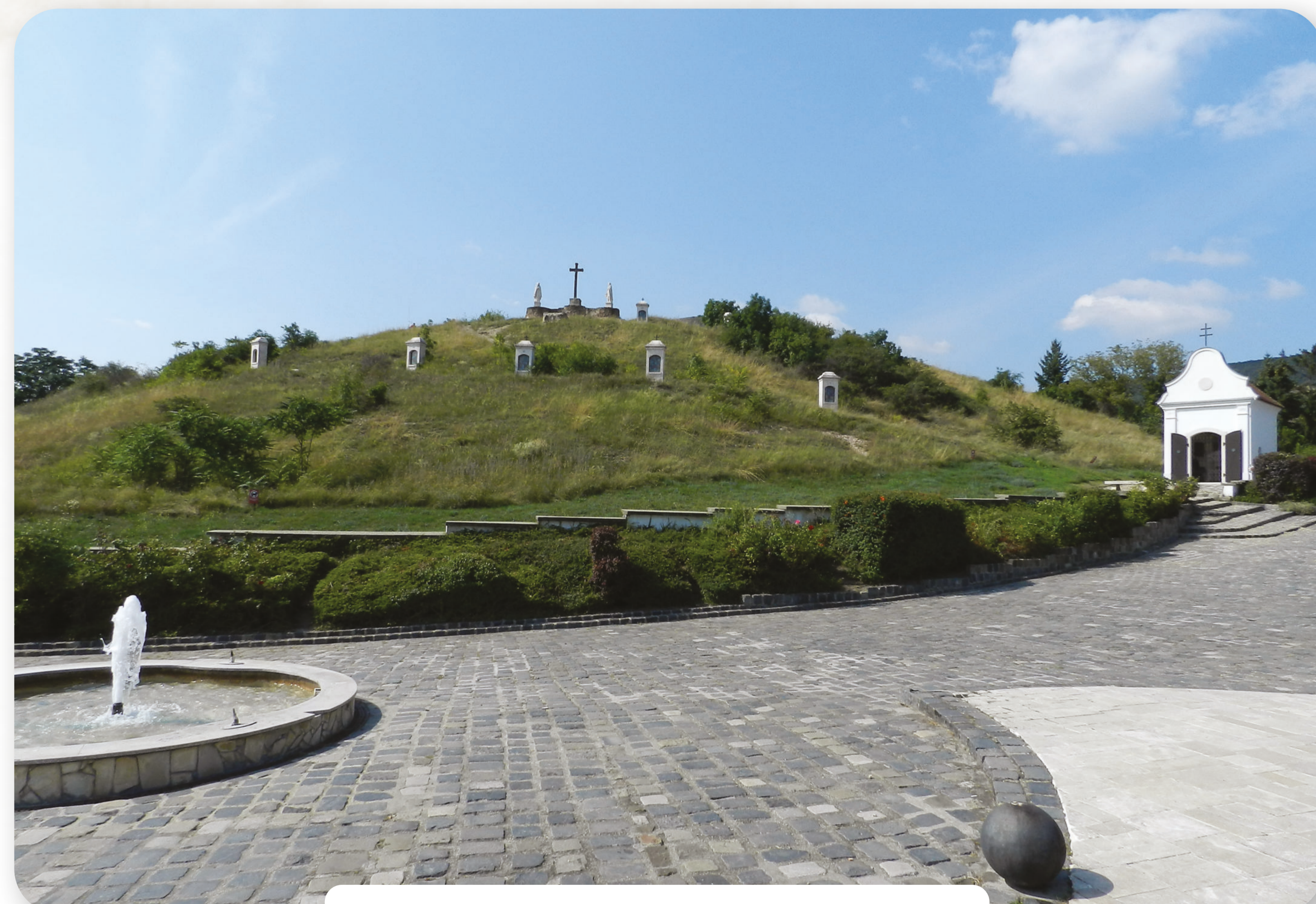
A Kálvária-domb 2023-ban / Der Kalvarienhügel 2023

A kiállítás megvalósítását támogatta / Die Umsetzung der Ausstellung wurde unterstützt: Heimatverein Budaörs/Wudersch e. V. und Budaörser Heimatmuseum Bretzfeld