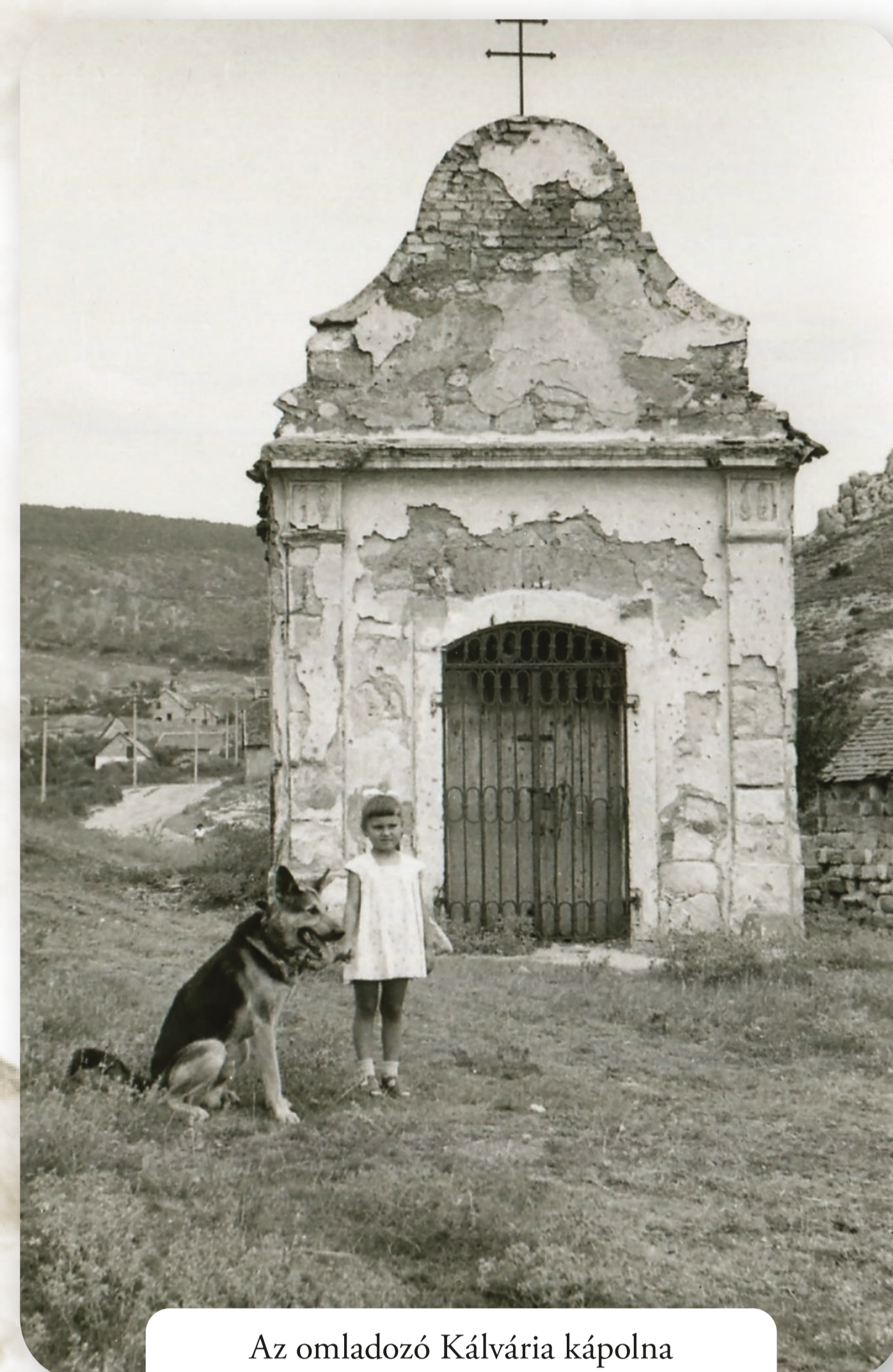
Az omladozó Kálvária kápolna Die zerfallende Kalvarienkapelle