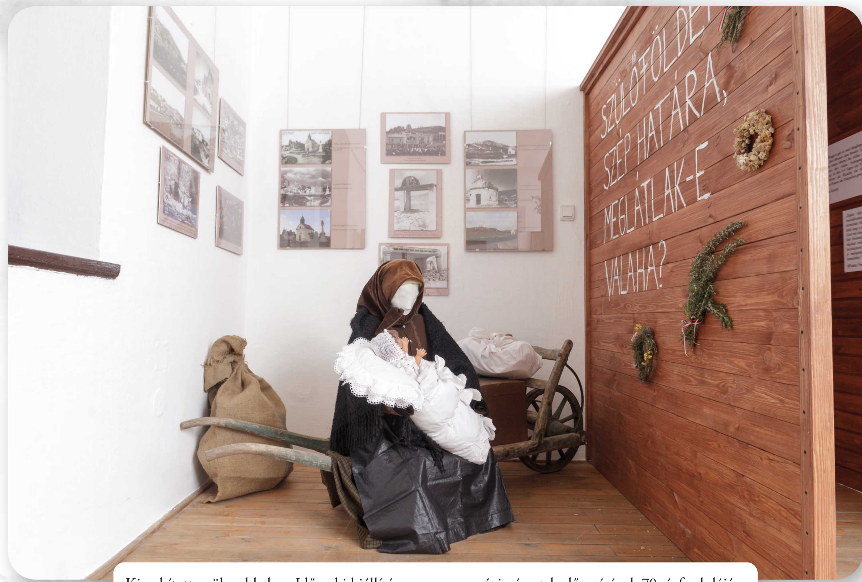
Kiszakított gyökerekkel... Időszak kiállítás a magyarországi németek elűzetésének 70. évfordulóján, Jakob Bleyer Heimatmuseum Budaörs, 2016 Mit ausgerissenen Wurzeln... Sonderausstellung zu 70-Jahre-Vertreibung im Jakob Bleyer Heimatmuseum, Wudersch 2016