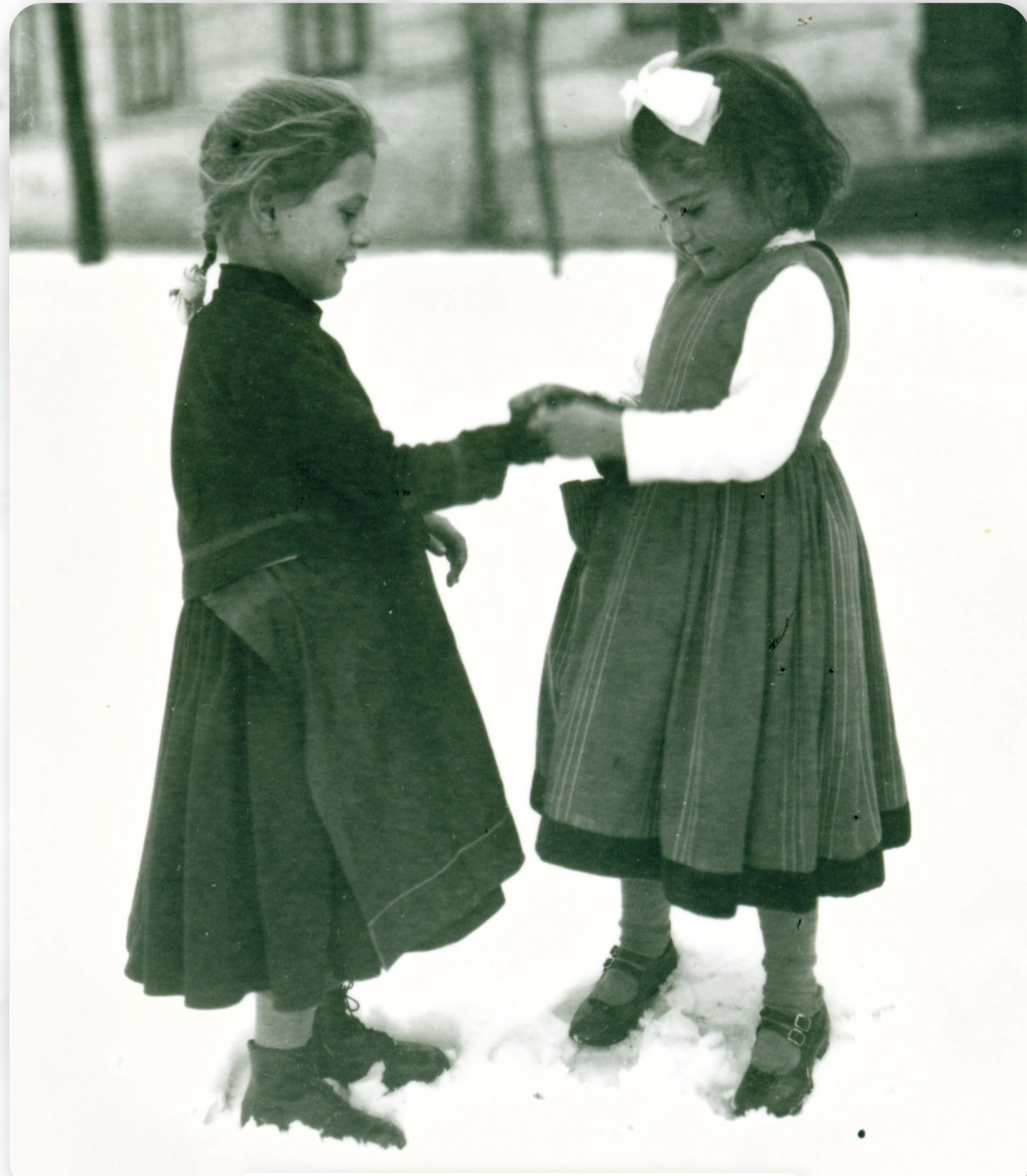
Magyarországi német gyerekek - 1944 őszén gyökeresen megváltozott eddigi életük. Ungarndeutsche Kinder - mit dem Herbst 1944 endete grundsätzlich ihr bisheriges Leben