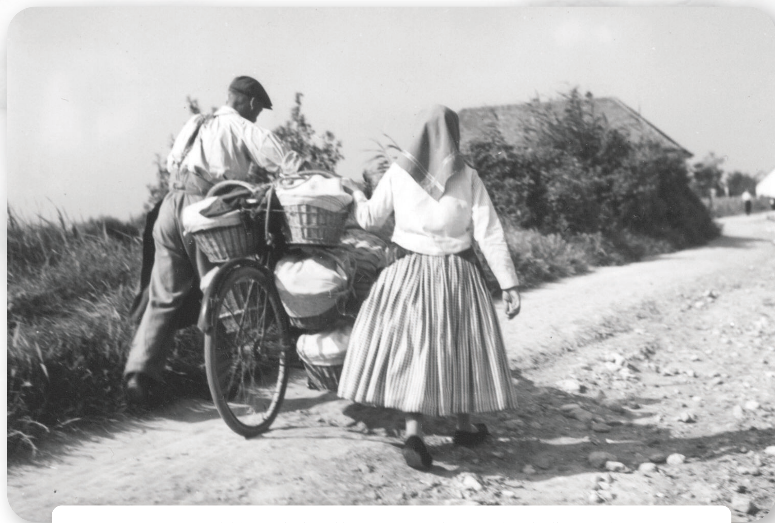
A magyarországi németek lakta területekre többnyire a mezőgazdasági munka volt jellemző. Sok magyarországi német gazdát – köztük jómódú „sváb-kulákok” – nem nézett jó szemmel az új kommunista rendszer, sokan közülük elkobzások, internálások vagy állambiztonsági megfigyelések áldozatai lettek. Die mit Ungarndeutschen bewohnten Gebiete waren vor allem von der Landwirtschaft geprägt. Viele Ungarndeutsche – unter ihnen die wohlhabenden „Schwaben-Kulaken” – passten nicht ins Konzept des neuen kommunistischen Systems, viele von ihnen wurden enteignet, von den ungarischen Staatssicherheitsdiensten überwacht oder interniert.