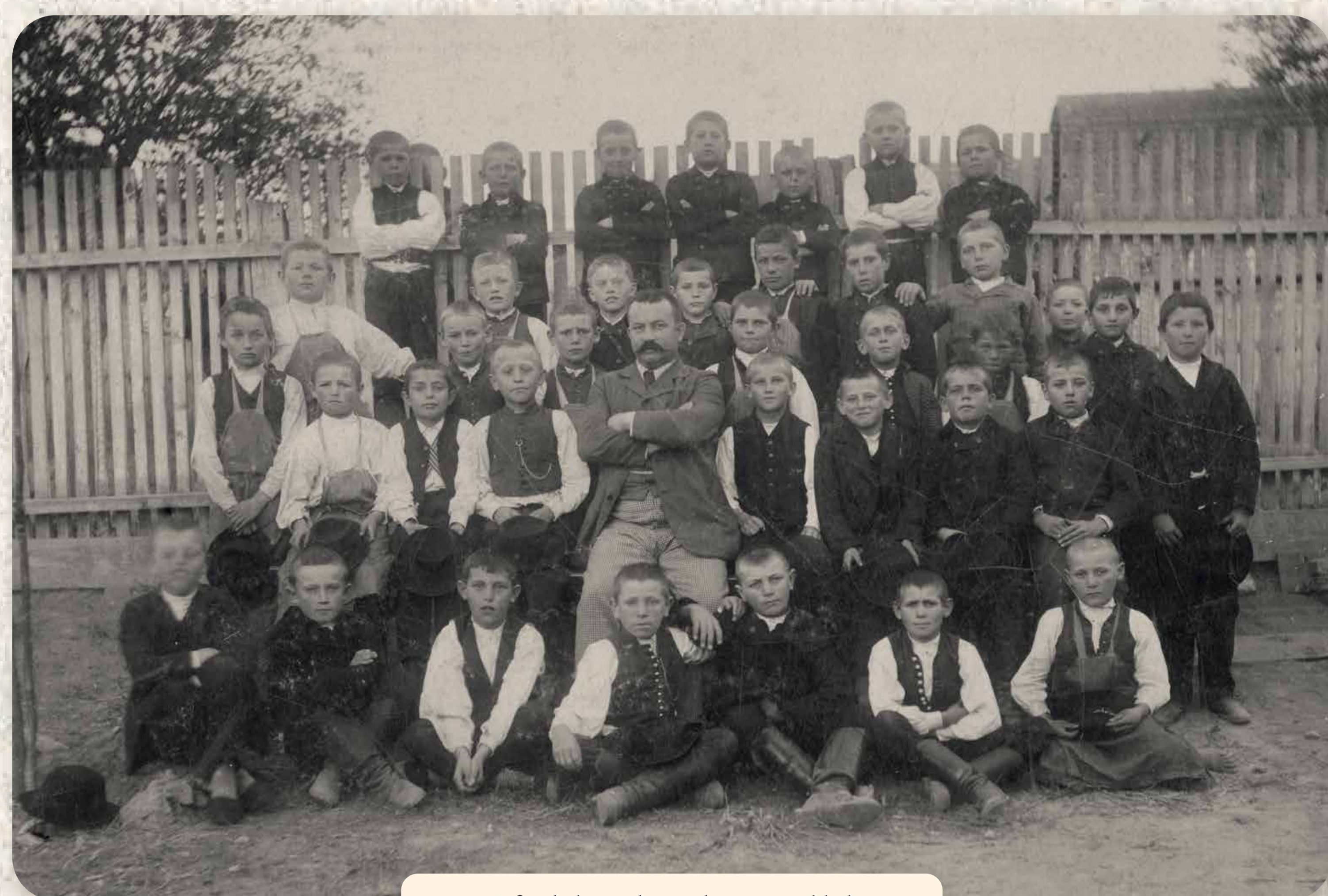
A fiúiskola egyik osztálya tanítójukkal Eine Schulklasse der Knabenschule mit ihrem Lehrer