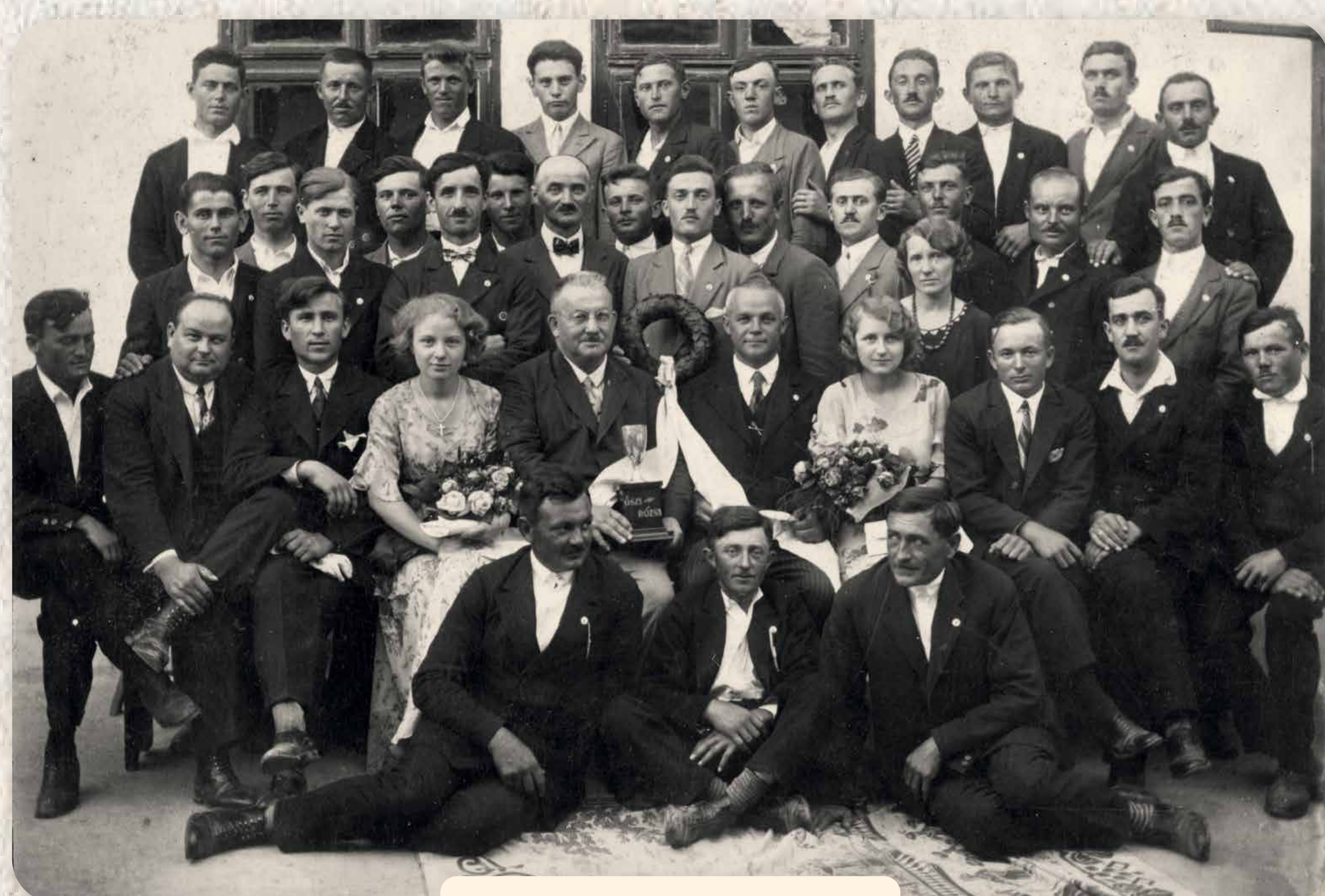
A Lyra Dalkör tagjai 1930 körül Mitglieder des Lyra Gesangsvereins um 1930