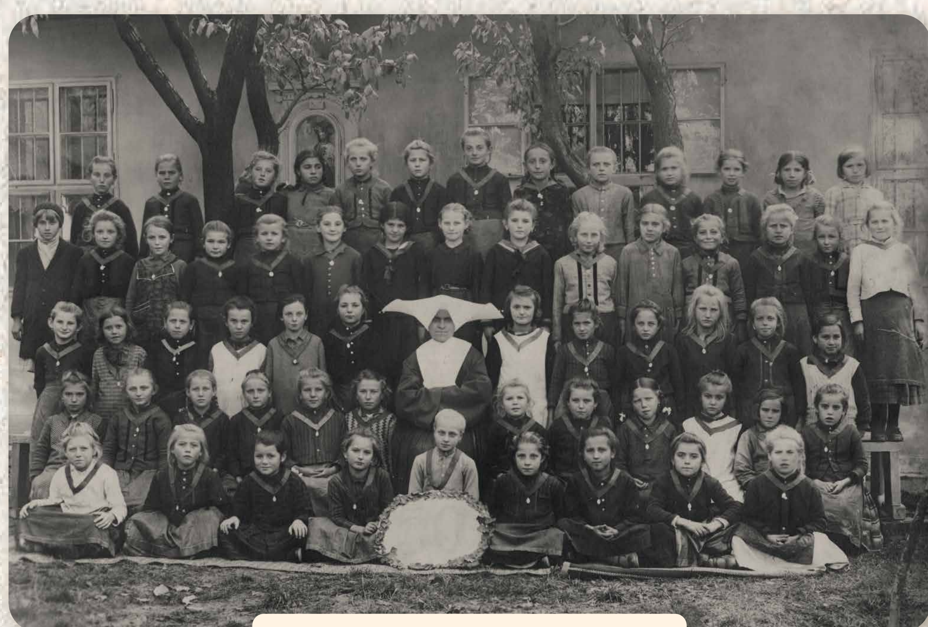
Irgalmas Nővér a leányiskola tanulóival Barmherzige Schwester mit Schülerinnen der Mädchenschule

Das blühende Vereinsleben wurde durch den Zweiten Weltkrieg unterbrochen, und die nachfolgenden politischen Veränderungen machten die Neugründungen unmöglich.