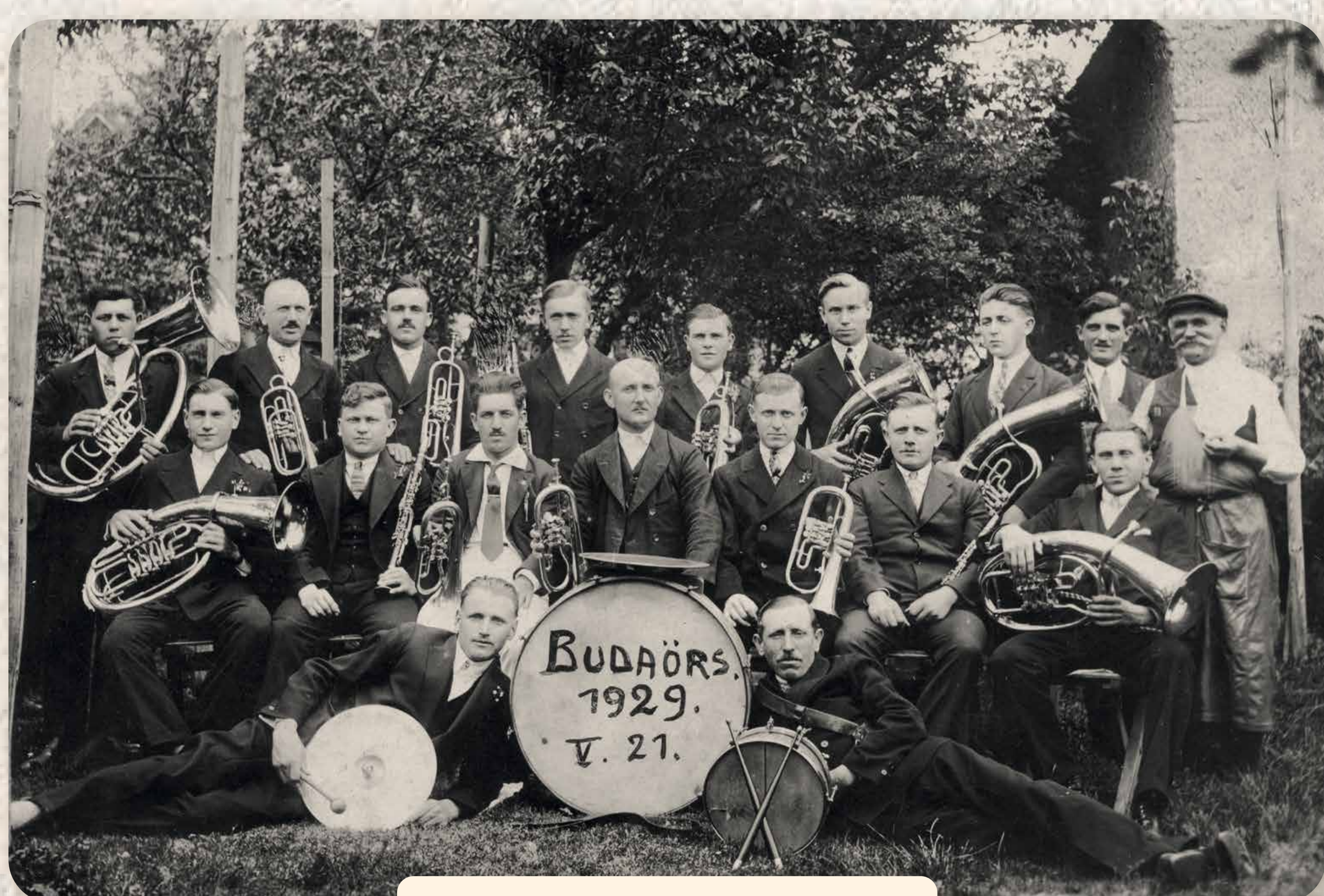
Budaörsön nagy hagyományai vannak a fúvószenének In Budaörs hat die Blasmusik bedeutende Traditionen