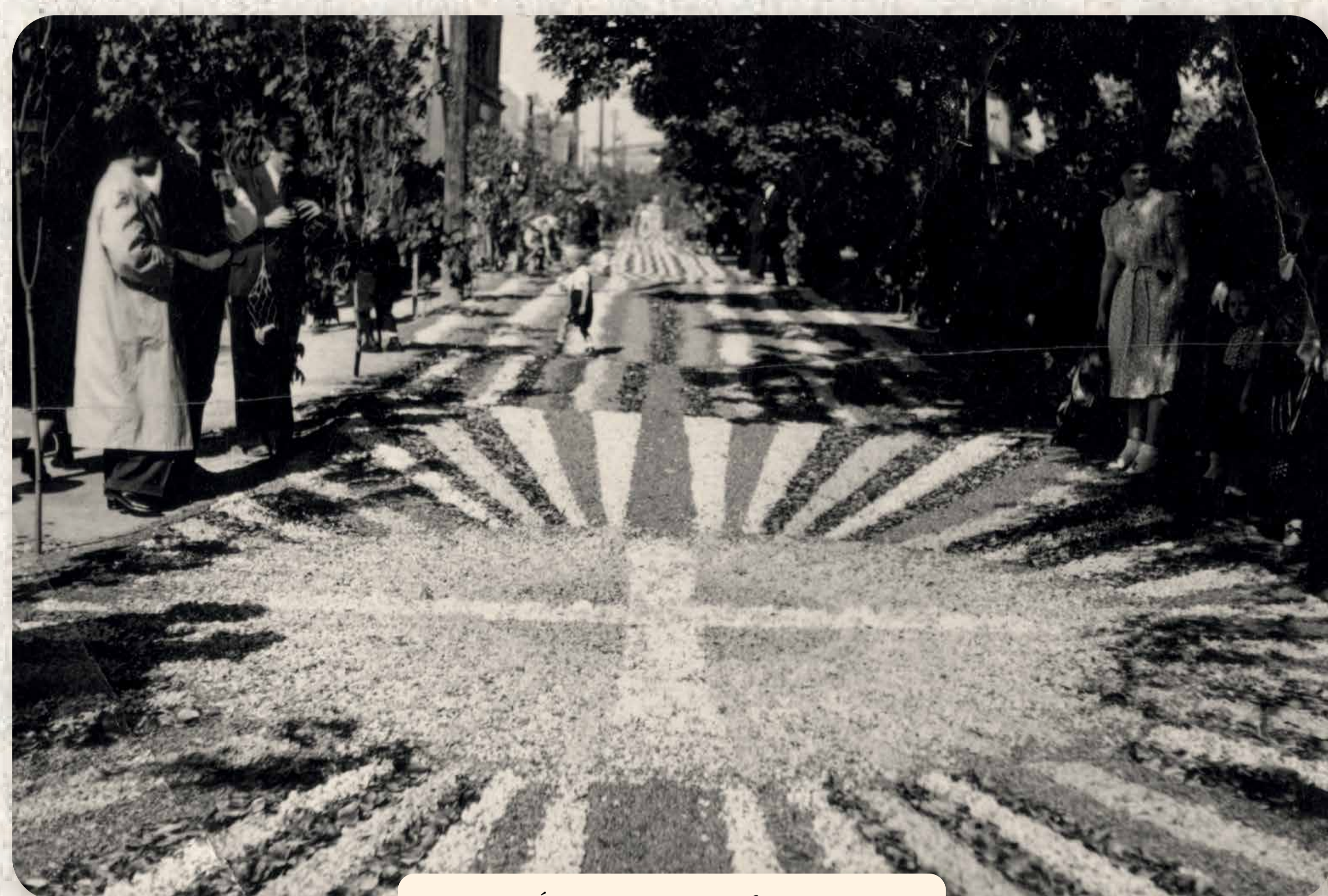
Úrnapvi virágszőnyeg a főúton Blumenteppeich zu Fronleichnam auf der Hauptstraße