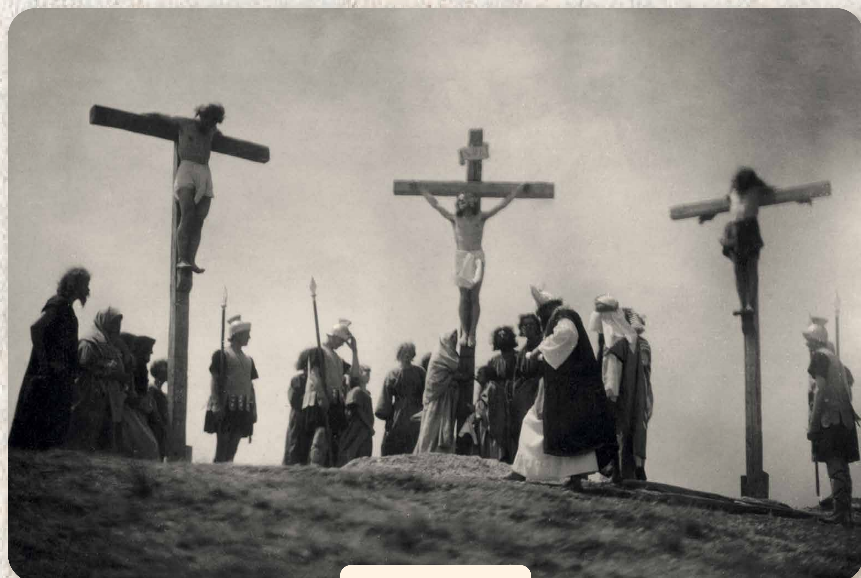
A keresztre feszítés jelenete Die Szene der Kreuzigung