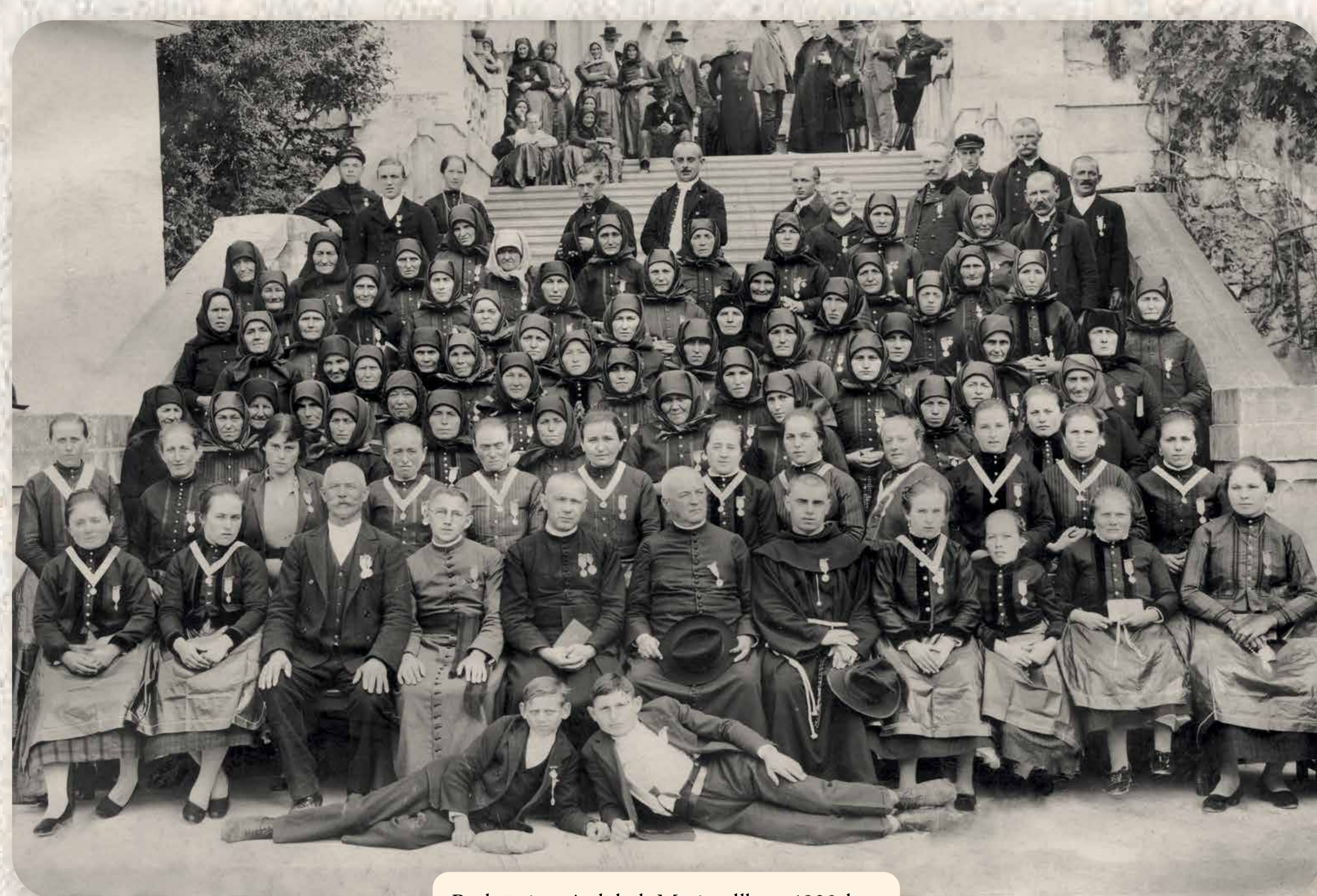
Budaörsi zarándokok Mariazellben, 1930-ban Budaörser Pilger in Maria Zell im Jahr 1930