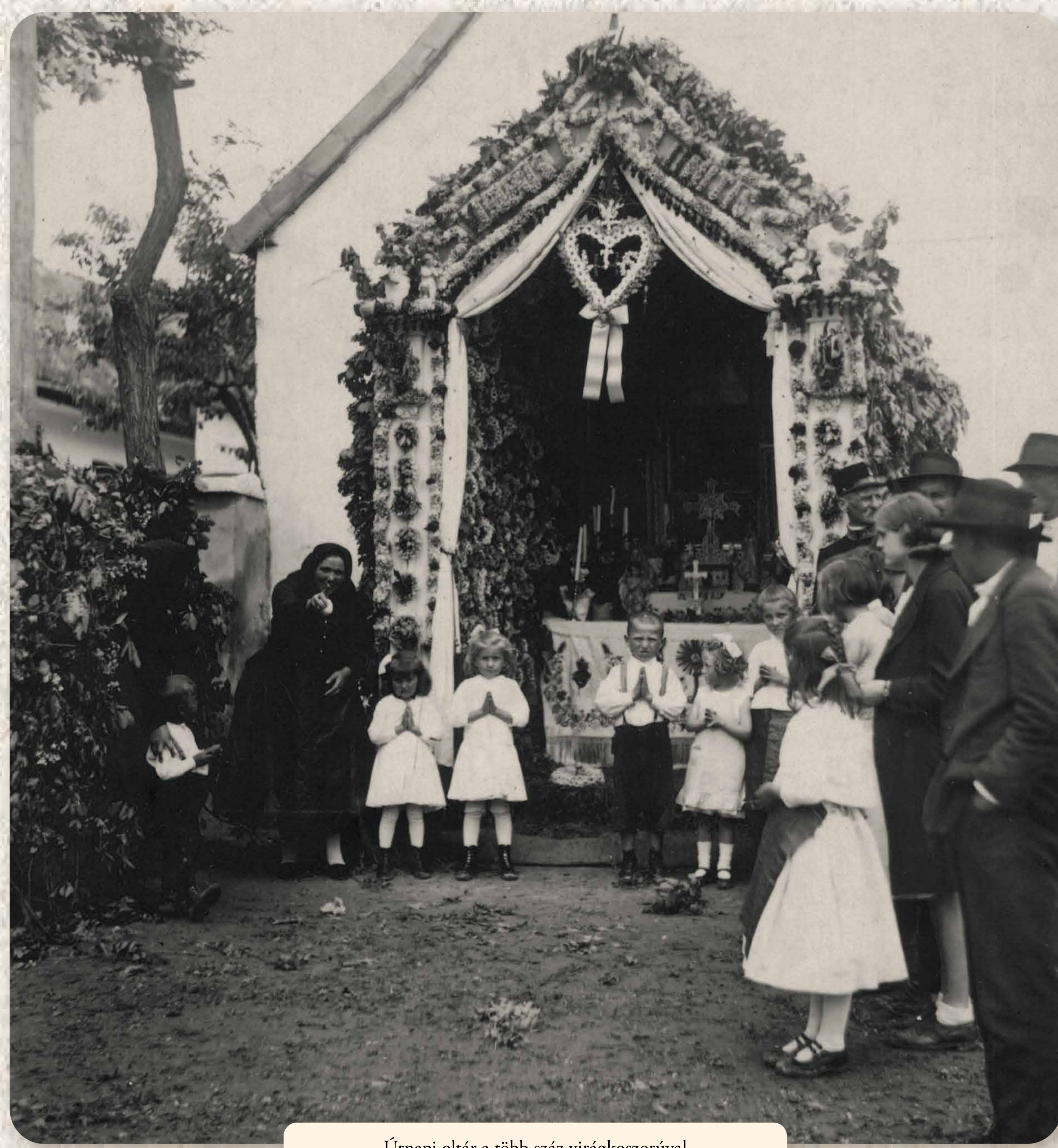
Úrnapvi oltár a több száz virágkoszorúval Altar zu Fronleichnam mit mehreren hundert Blumenkränzen