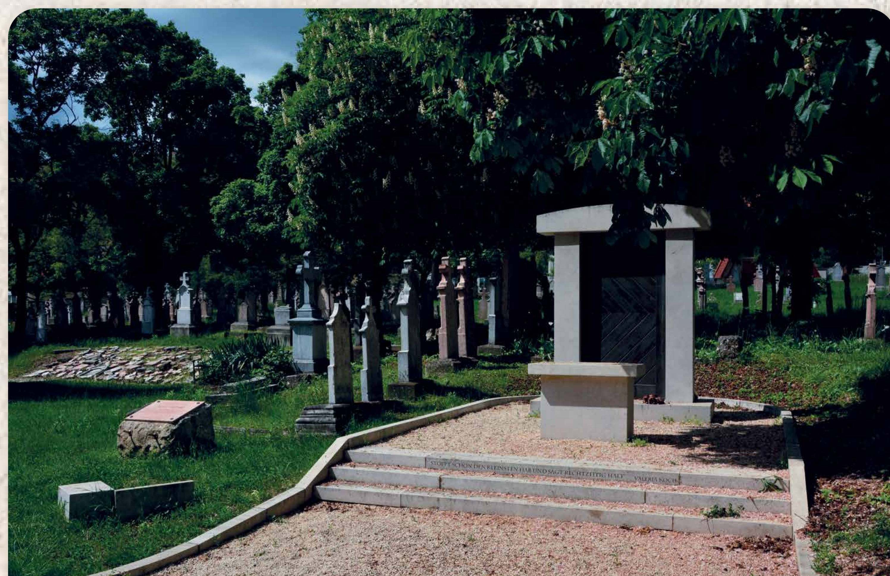
A budaörsi Ötvenötben 2006-ban, a kitelepítés 60. évfordulóján avatták fel az országos kitelepítési emlékművet. Im Alten Friedhof in Budaörs wurde 2006, zum 60-jährigen Jubiläum der Aussiedlung das Landesvertreibungsdenkmal eingeweiht.