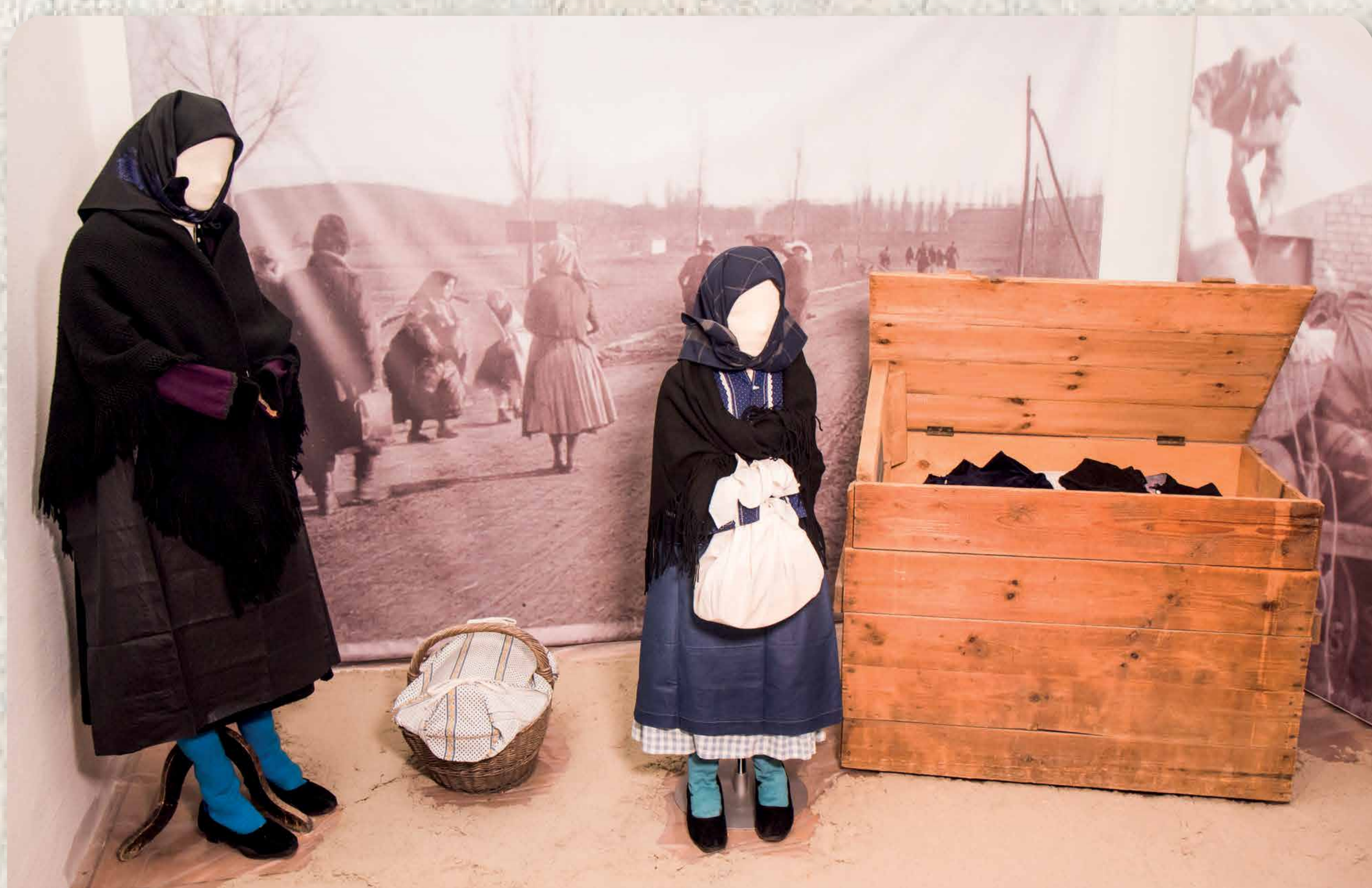
Részlet a Heimatmuseum 2016-os időszaki kiállításából. Teilansicht der temporären Ausstellung im Jahr 2016 im Heimatmuseum.