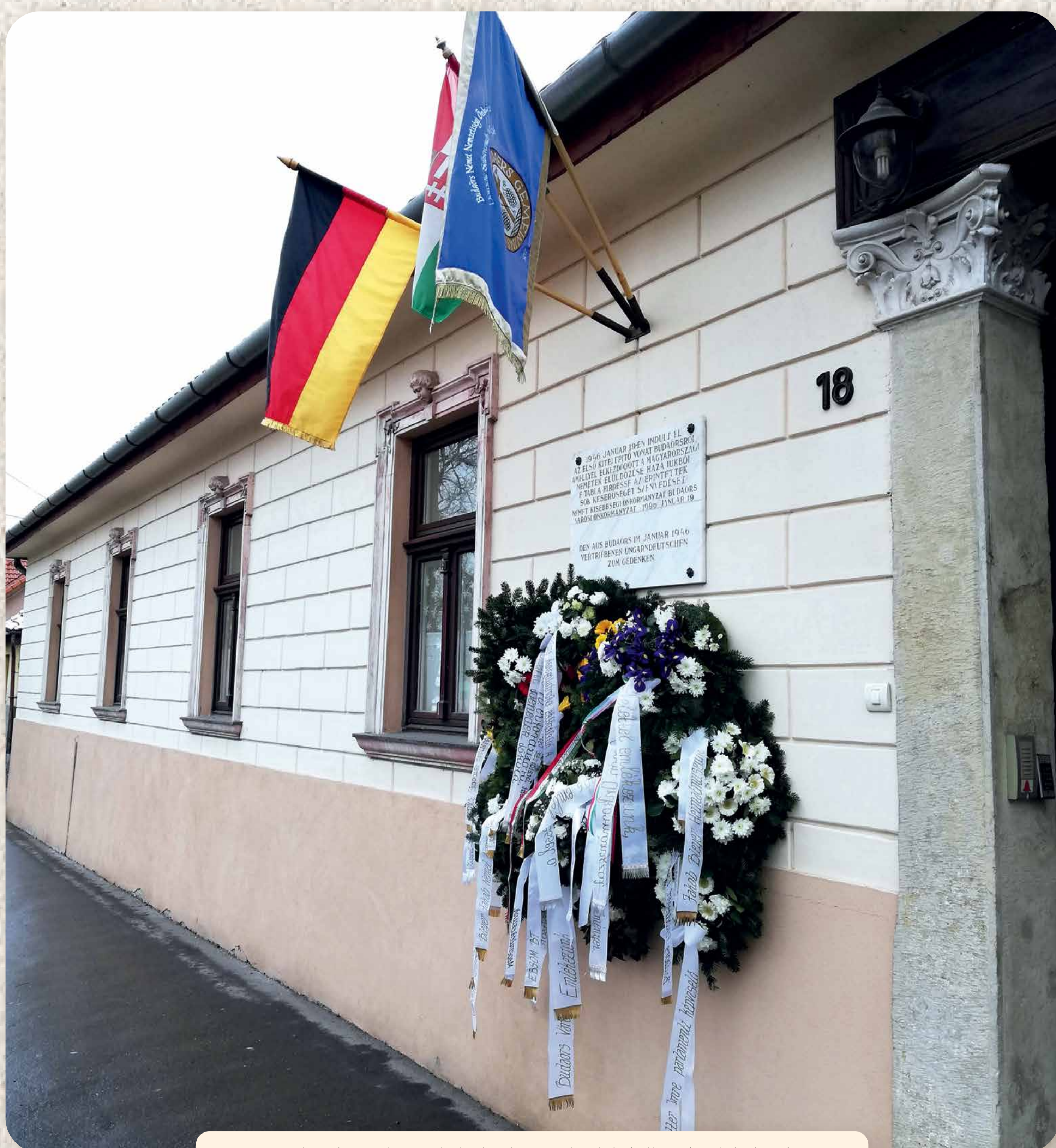
Az egykori községháza, ahol a kitelepítetteknek le kellett adniuk kulcsaikat. Az épületen 1996-ban helyezték el emléktáblát. Das ehemalige Gemeindeamt, wo die Ausziedelnden ihre Schlüssel abgeben mussten. Am Gebäude wurde 1996 eine Gedenktafel angebracht.