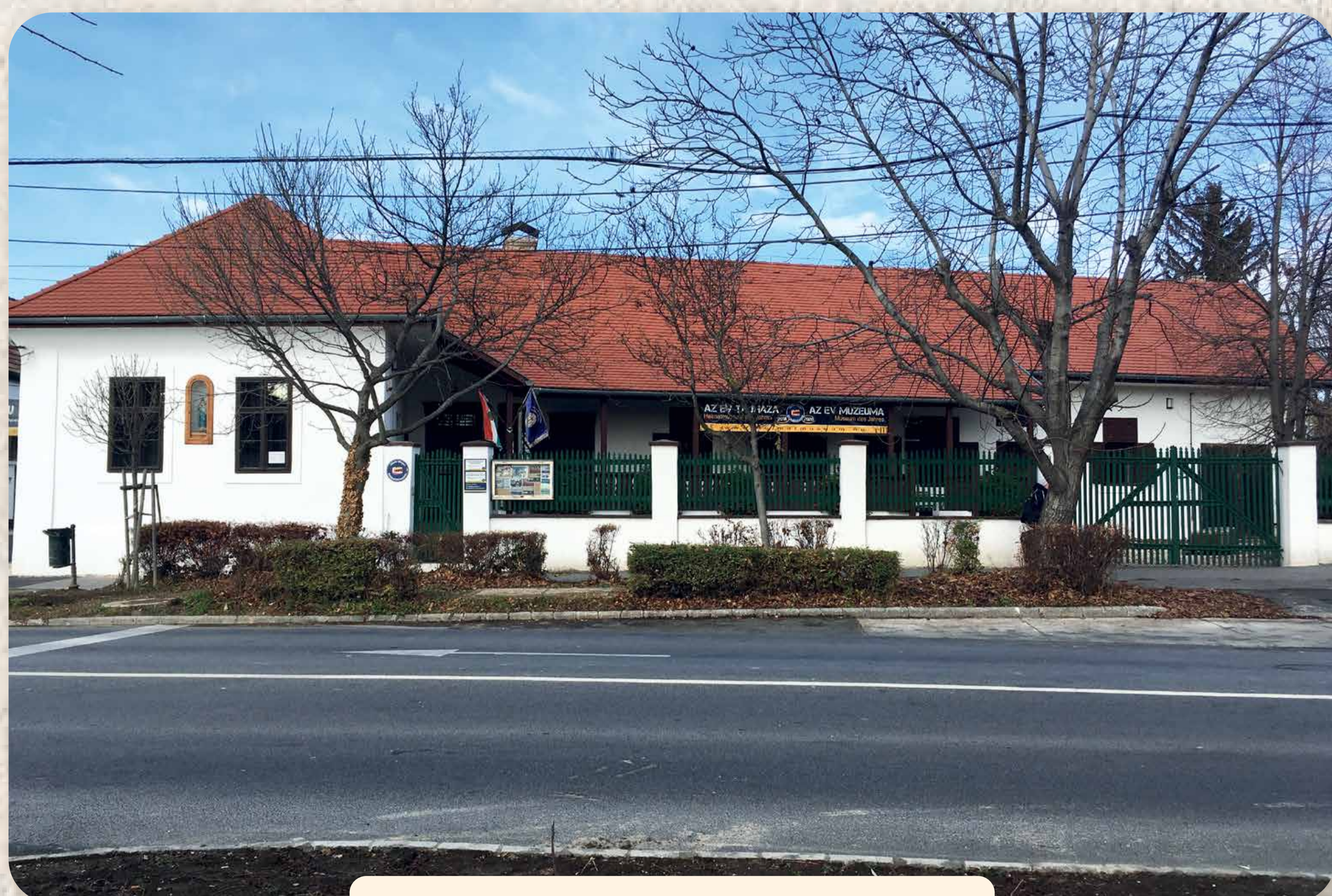
A Heimatmuseum 2016 és 2018 között teljes körű felújításon esett át Das Heimatmuseum wurde von 2016 bis 2018 vollständig erneuert