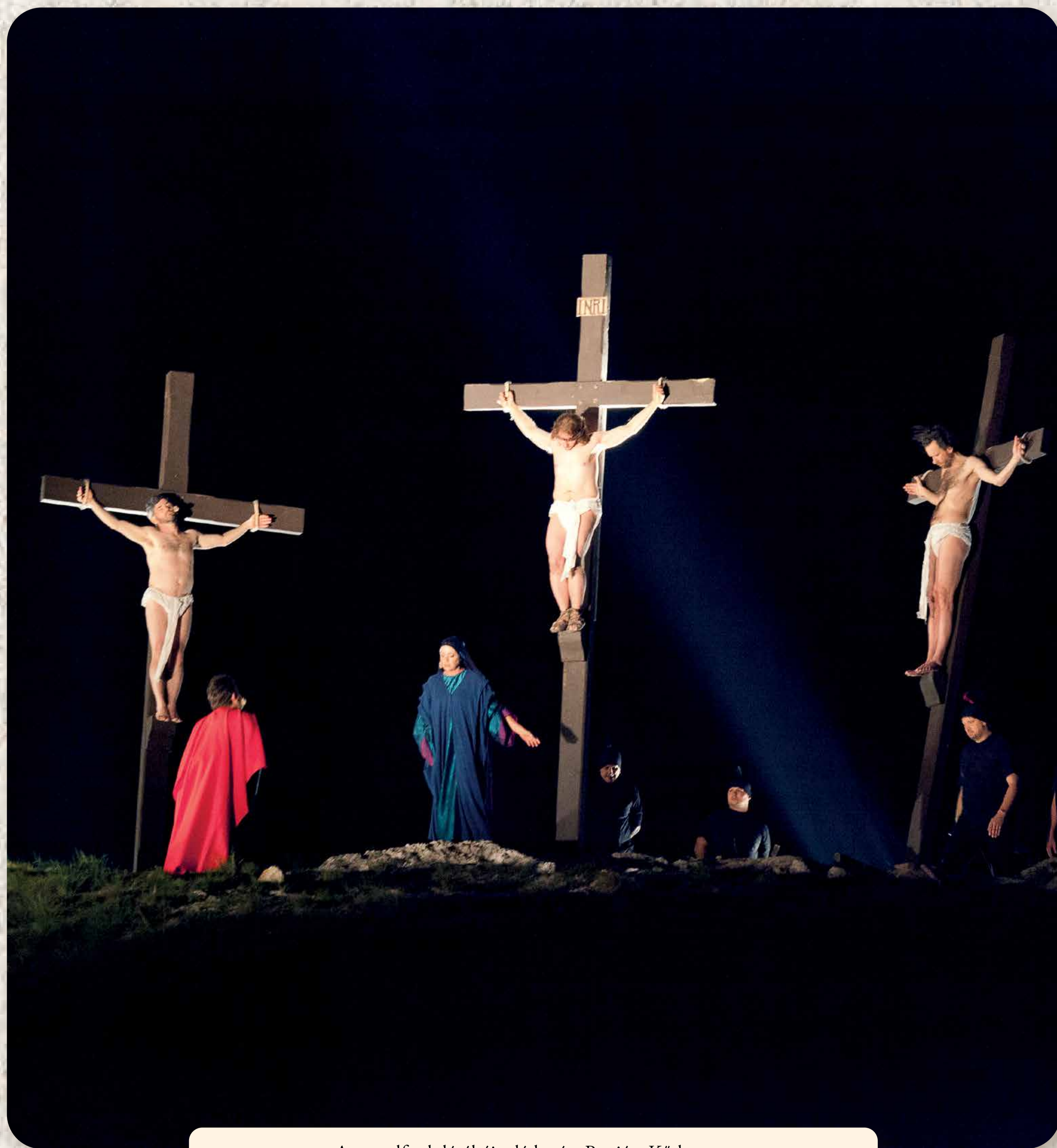
Az ezredfordulótól újra látható a Passió a Kő-hegyen Nach der Jahrtausendwende sind die Passionsspiele auf dem Steinberg wieder zu sehen