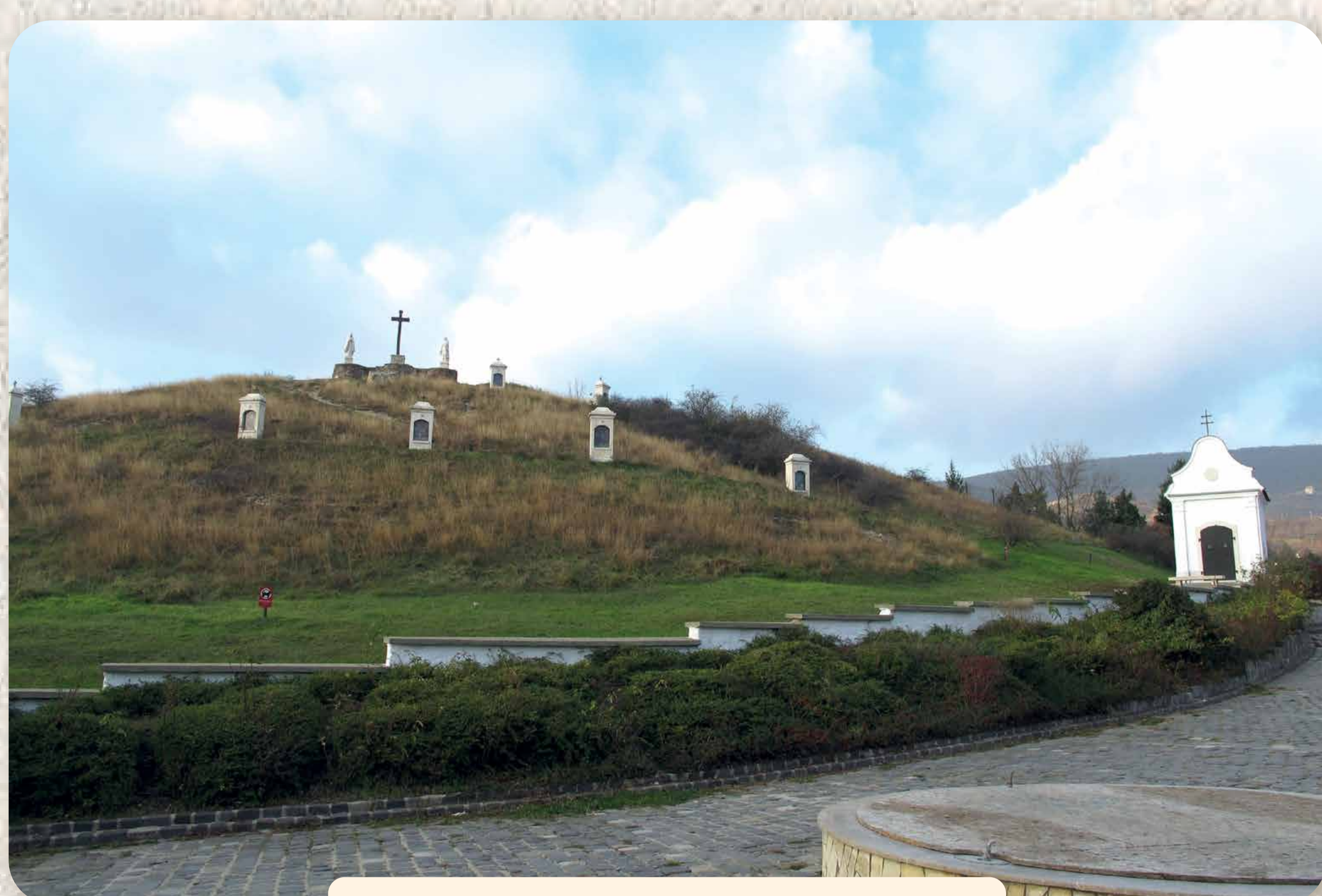
A keresztrút és a Kálvária kápolna 2002-re épült újjá Der Kreuzweg und die Kalvarienkapelle wurden 2002 neuerrichtet

Das Jakob Bleyer Heimatmuseum und die Nationalitäten Selbstverwaltung kümmern sich außer der Bewahrung der Gegenstände auch um deren Vorstellung, sie fördern die wissenschaftliche Forschung, die Weitergabe des Wissens, sie halten die kleine örtliche Gemeinschaft zusammen, achten auf das Retten der angegriffenen und der zerstörten Werte. Als Ergebnis dieser Tätigkeit erschienen zahlreiche Publikationen, der Alte Friedhof wurde wiederhergestellt, der Kalvarienberg rekonstruiert, die Steinbergkapelle neugebaut und im Jahr 2000 wurden die berühmten Passionsspiele wiederbelebt.