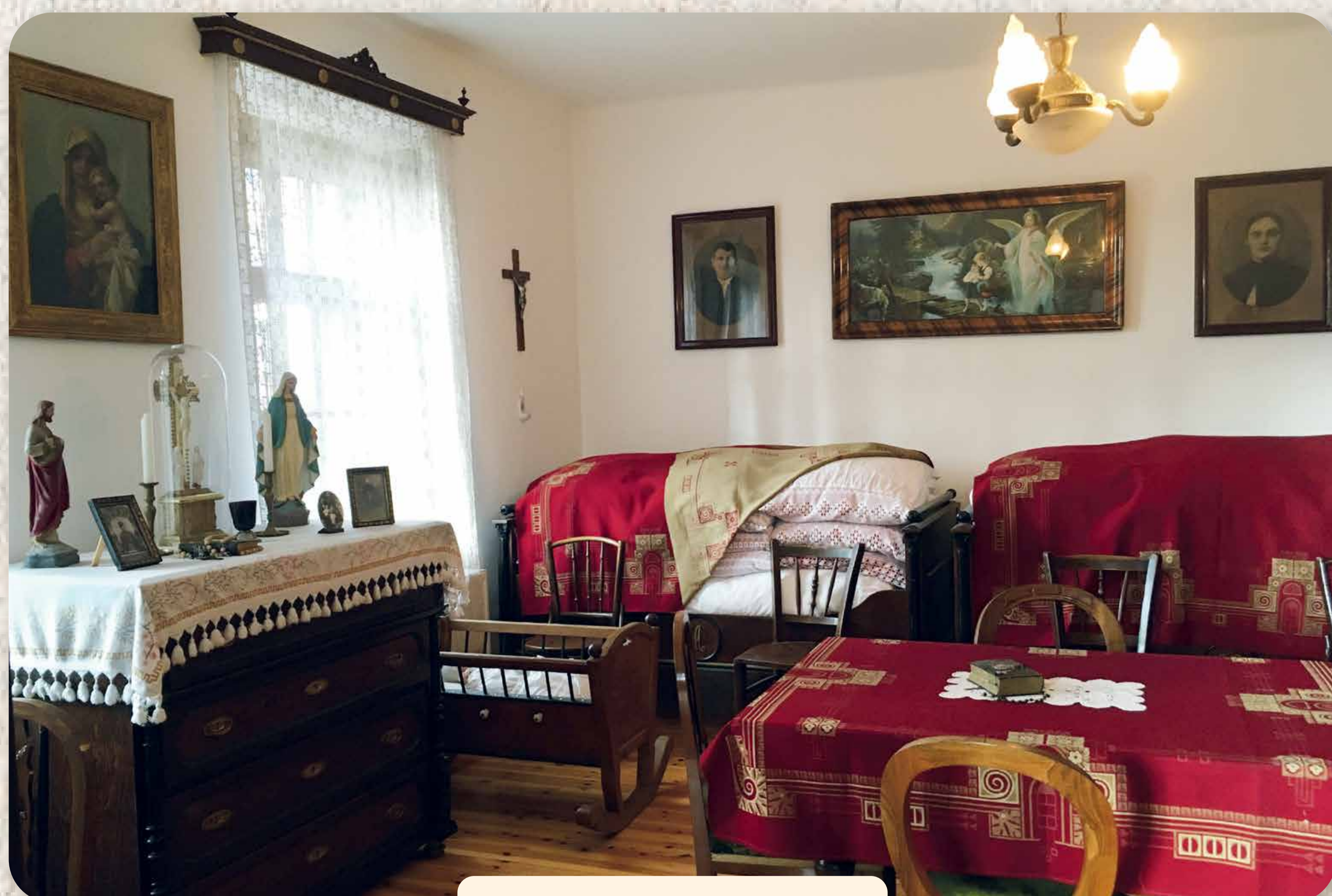
A Heimatmuseum tisztaszobája Das Paradezimmer des Heimatmuseums