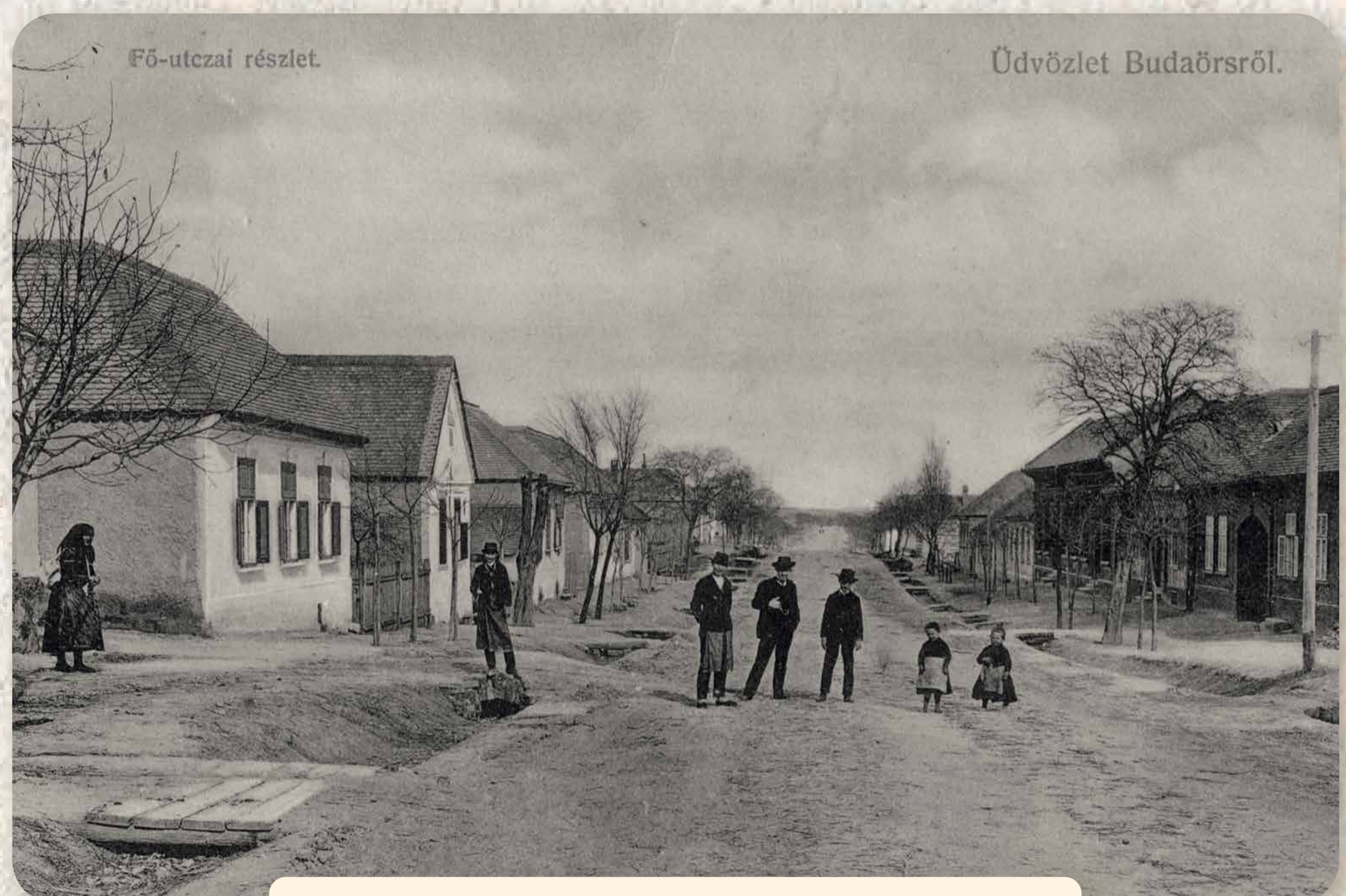
A hagyományos népi építészet mára csak nyomokban őrződött meg. Die herkömmliche volkstümliche Bauweise ist nur in Spuren erhalten geblieben.

Obwohl die Verbürgerlichung in Budaörs schnell vor sich ging, spielte im Lebensunterhalt die Landwirtschaft eine besondere Rolle. Daneben gab es aber auch eine gut entwickelte Industrie, die Ortschaft hatte kleinere Betriebe und Fabriken: Hölle-Sekt, Eller-Strickerei usw.